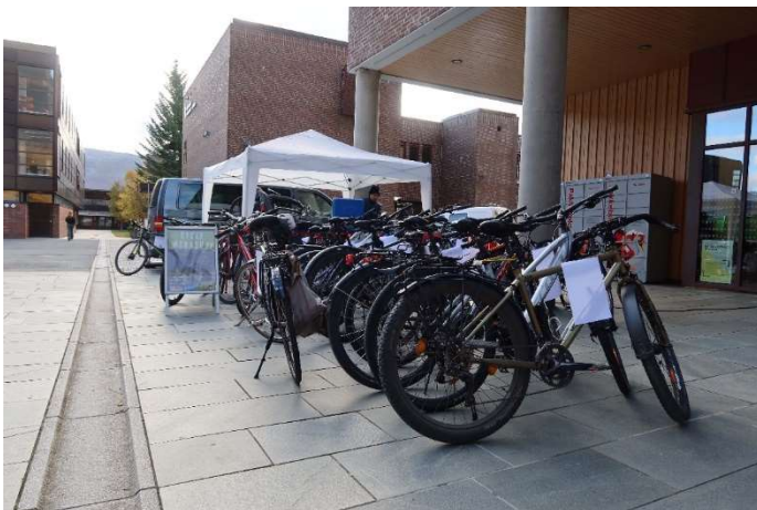
Sykkelsørvis første dag september 2022.

UiT har dårlige fasiliteter for sykkelsørvis, men leverandør av sykkelsørvis hadde med telt og annet nødvendig materiell. Vi fikk god hjelp av BEA drift til stedet vi fikk tildelt.