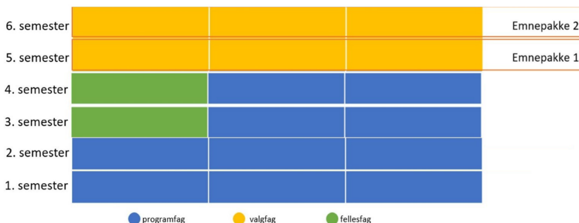
Figur 1. BFEs forslag til endret grunnmodell bachelor med justerte rammer for omfang programfag, omfang av fellesfag, og endret plassering av valgfag og fellesfag. Valgfag er flyttet fra 3. og 4. semester til 5. og 6. semester. Fellesfag er redusert til maksimalt 20 studiepoeng og gis i 3. og 4. semester. Eksempel med program med 100 studiepoeng programfag og 20 studiepoeng fellesfag. Ved økning programfag til 110 studiepoeng reduseres fellesfag til kun 10 studiepoeng som gis enten i semester 3. eller 4.