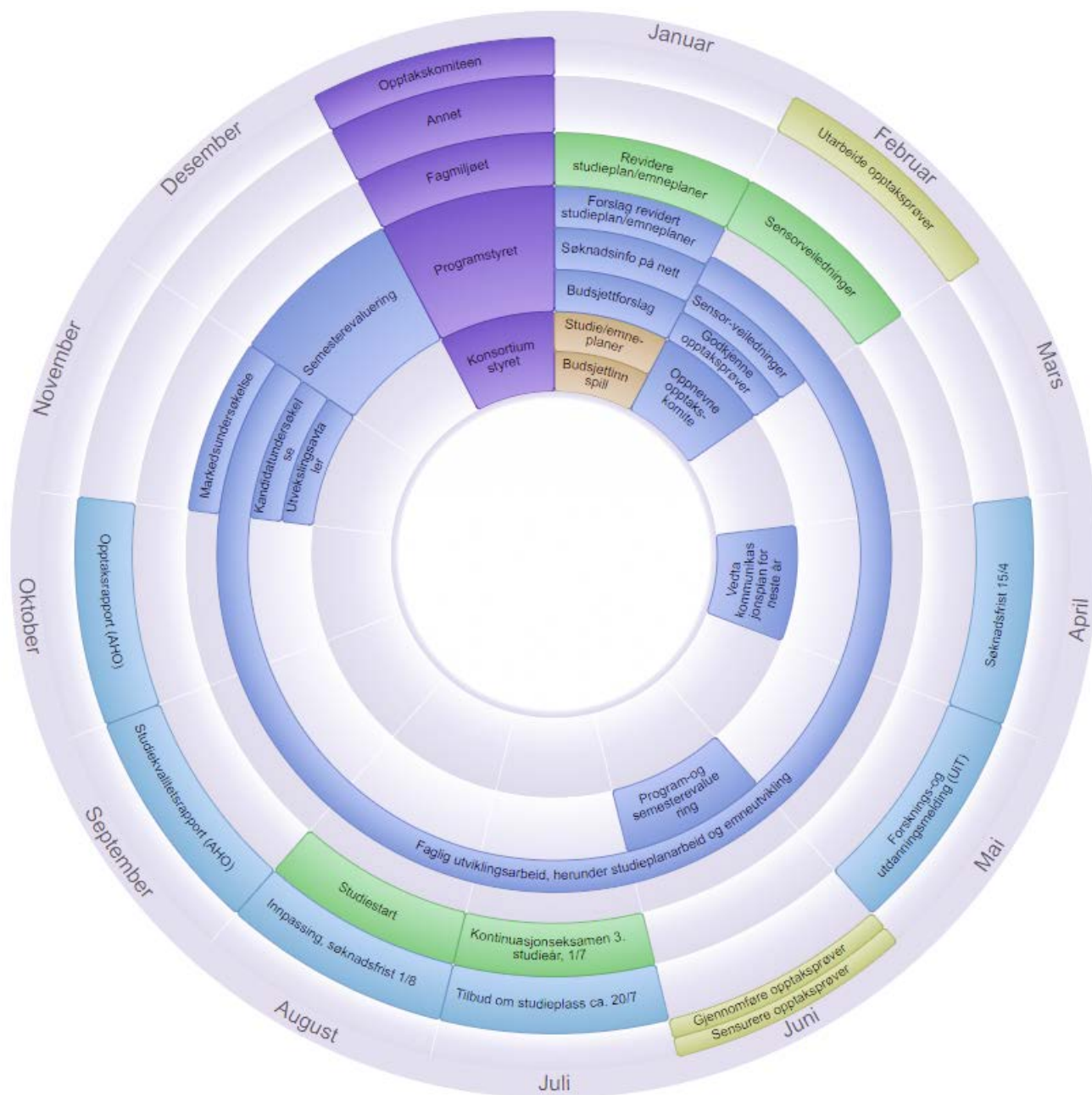
Figur 2. Årshjul for fellesgradsprogrammet med vekt på kvalitetsstyringsaktiviteter.

Evalueringer, rapportering og andre oppgaver følger så langt som mulig ordinære rutiner og frister ved institusjonene. Fellesgradsprogrammet innarbeides i de to institusjonenes studieprogramportefølje for å sikre dette.