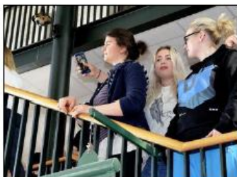
JUBILEUM: Ansatt og studenter bidro under 50-årsmarkeringen ved UIT trinn.