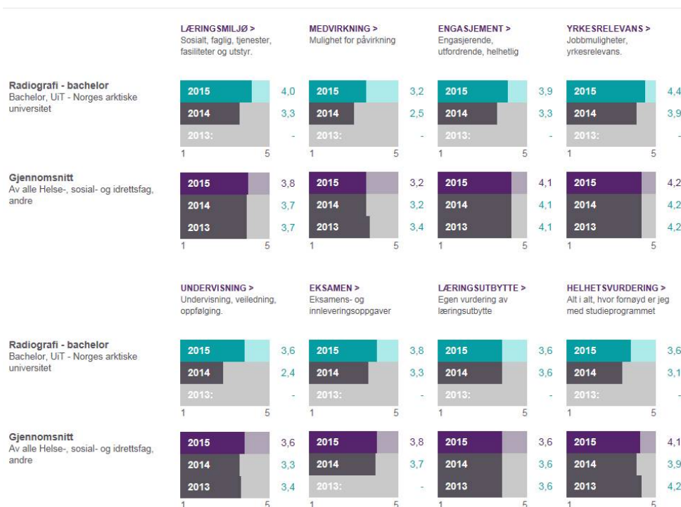
Figur 3: Resultater for bachelor i radiografi