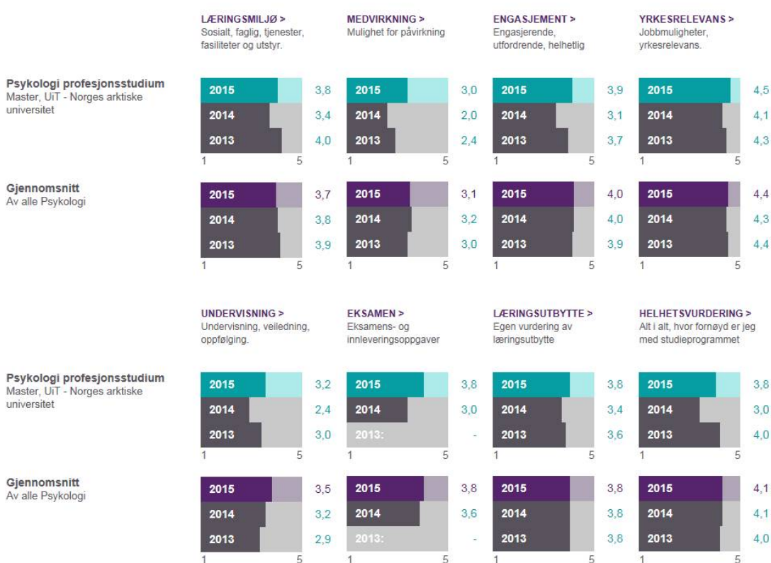
Figur 5: Resultater for profesjonsstudiet i psykologi

Vis gjennomsnittsverdier for studieprogrammets utdanningsgruppe Vis historiske data