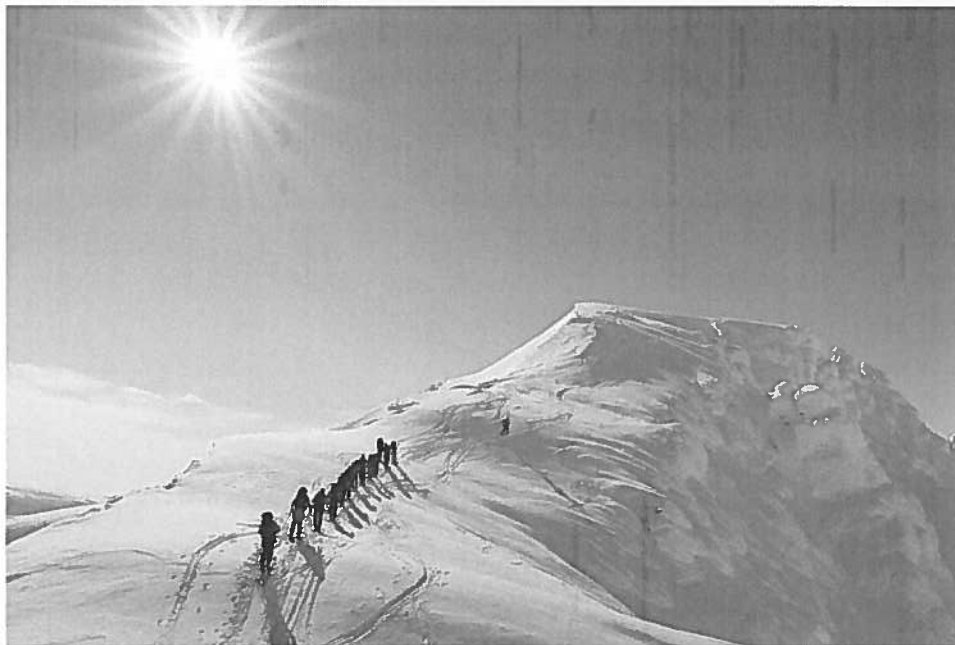
På tur opp Holmbukttinden, en av flere topper som ble passert på turen.

Vi hadde også et tilbud om rabattert pris på skredkurs og 4 deltok. 5 deltok på en rabattert tur over Jiekkivare som er den høyeste fjelltoppen i Troms.