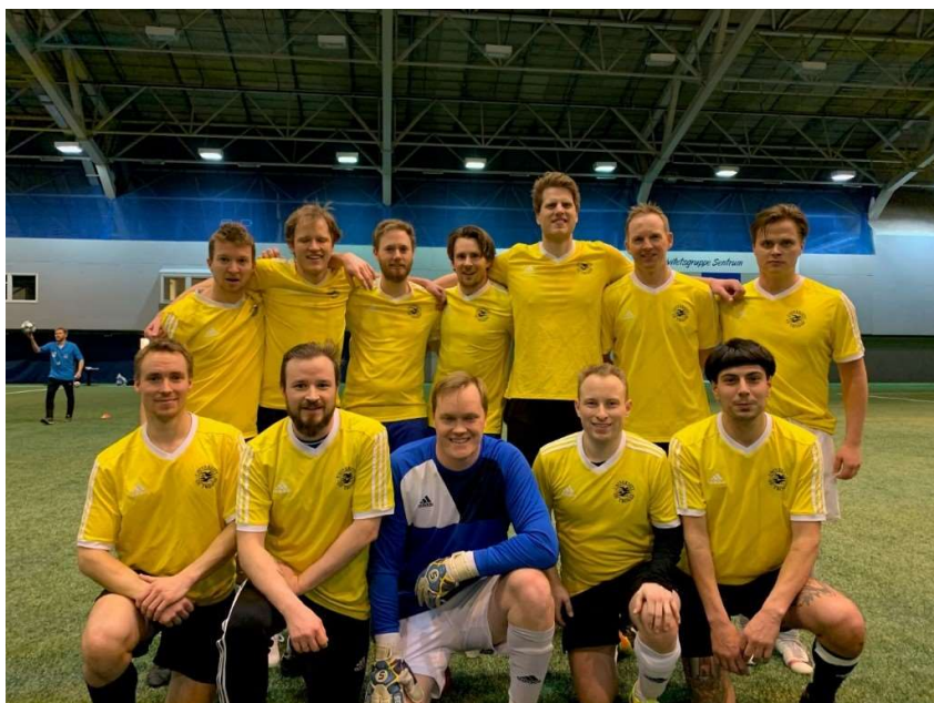
Lagbilde av UiT BIL herrer etter 2.plass i Tromsø Cup, november 2019.

Fotballåret 2021 har vært preget av korona og lite aktivitet. Så fort restriksjonene ble hevet var vi imidlertid raskt på ballen og i gang igjen med våre 2 fast treninger i uke. Budsjettforslaget for 2022 er tilbake til normalen fra før covid.