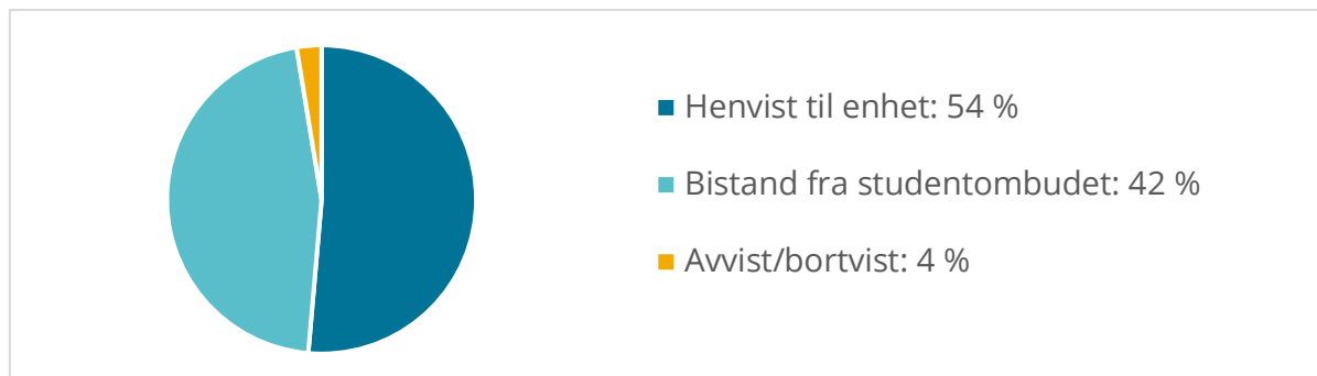
Figur 1 Innkomne henvendelser i rapporteringsperioden

I perioden fra 1. juli 2021 til 31. juni 2023 registrerte studentombudet 1012 henvendelser. Av disse fikk 427 henvendelser bistand og/eller oppfølging av studentombudet, og omtales derfor i det følgende som saker. Av de resterende 555 ble 548 henvist til andre enheter ved UiT, mens 37 henvendelser ble avvist/bortvist.