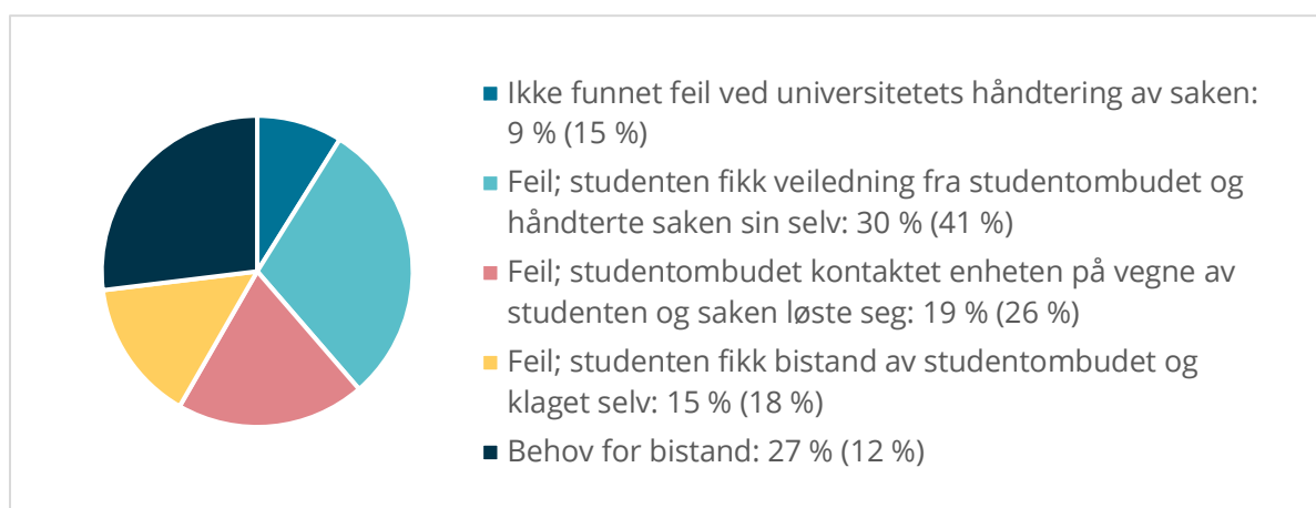
Figur 2 Utfall av saker i rapporteringsperioden. Tidligere periode i parentes.

hånd. Og i de fleste tilfellene hvor studentombudet må kontakte enhetene, løser saken seg raskt og effektivt, mens det i noen tilfeller ender opp med en formell klage fra studentene.